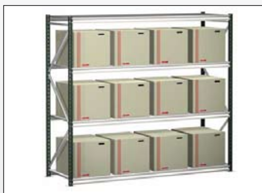
Udnytter pladsen mest muligt