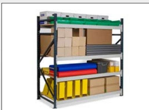
Plads til mange varetyper