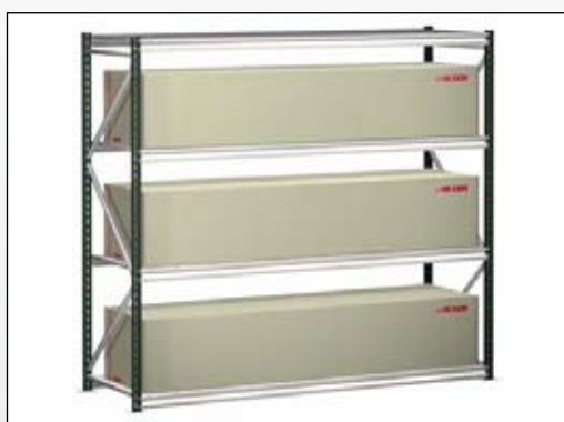
Specielt velegnet til langgoods