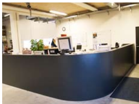
Den nye ekspeditionsskranke har medvirket til at samle medarbejderne i et åbent lagerkontormiljø.