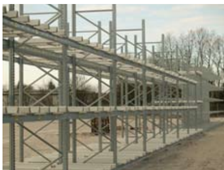
Kabeltromle- og grenreoler monteret på det udendørs lagerområde.