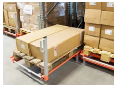
Palleudtræk og vacuumløfter er med til at sikre god ergonomi og et sikkert arbejdsmiljø.