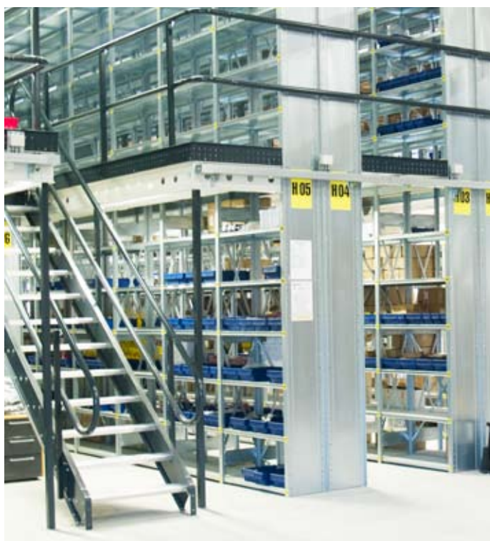
Med mezzanin imellem HI280 småvarereolerne udnyttes lokalehøjden. Smådele opbevares i plastkasser i reolerne.

mezzanin. Og vi skal nok få anvendt alle disse hyldemeter hen ad vejen, for med vores nye forretningsområder indregistreres hele tiden nye varenumre”.