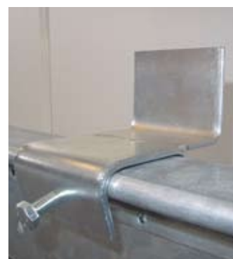
Horisontalt pallestop til venstre og vertikalt til højre.