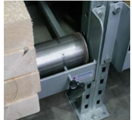
Stoppet, der sidder på fronten af indstiksreolen sikrer, at indholdet ikke ruller ud ad reolen.

vognmænd", fortsætter XL Bygs lager- og logistikansvarlige. Meningen er, at alle kundebesøg fremover starter på salgskontoret, hvor der gives råd og vejledning samt laves en instruktion til det fagpersonale, som efterfølgende skal hjælpe kunderne igennem resten af købsprocessen. På leveringsordrer vil man have "locationsstyret ordreudprintning" fra printere, der er placeret på de forskellige vareområder i virksomheden. Denne organisering og styring af ekspeditioner og plukordrer giver et langt mere rationelt flow i hele virksomheden, hvor det så til gengæld er vigtigt, at varer og produkter er let tilgængelige