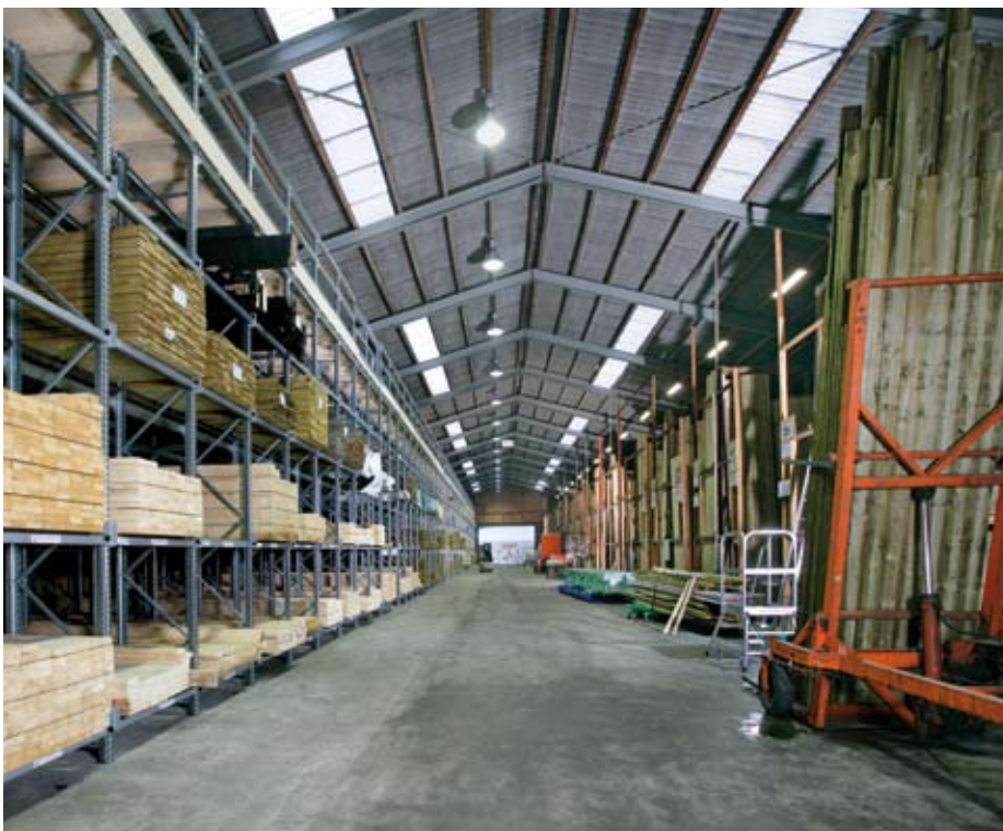
På venstre side den nye 80 meter lange indstiksreol - på højre side kvast i A-reoler der håndteres manuelt.

for både personale og kunder. Og i denne organisering er kompaktreolen fra Constructor en vigtig brik.